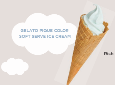
水色ソフト Rich milk soft serve ice cream ¥540